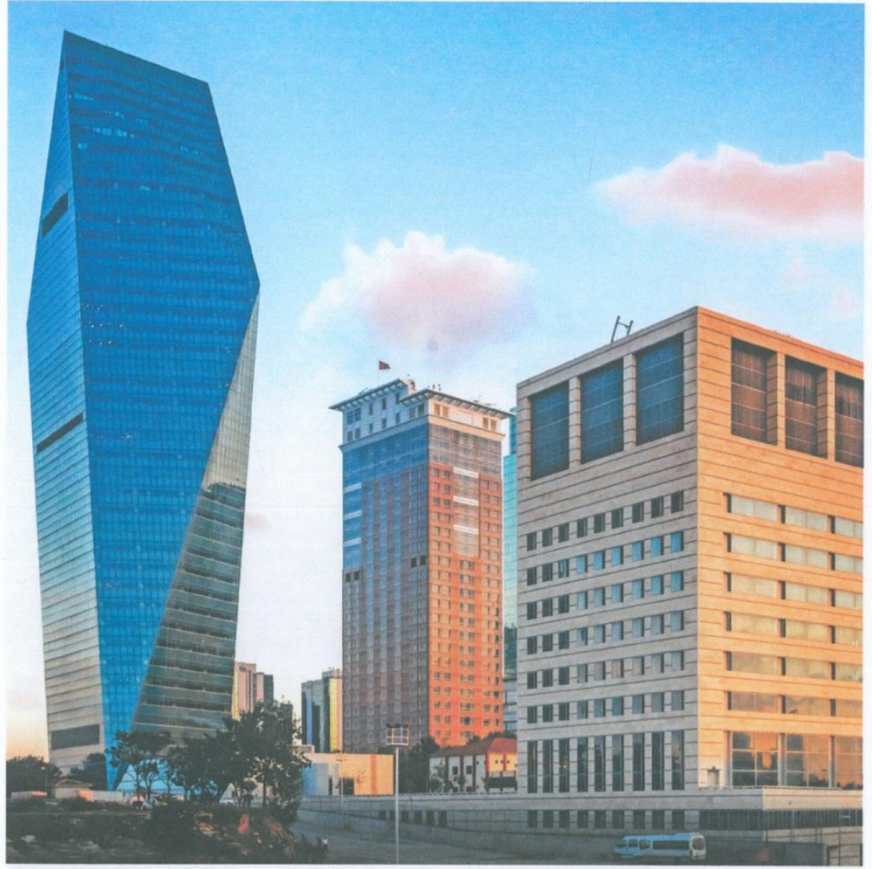
Kompleks, Finansbank Kristal Kule'nin yanı sıra bir de 63 metre yüksekliğinde büro (sağda) binasından oluşuyor.

Kule, Büyükdere Caddesi ve Fatih Sultan Mehmet Köprüsü gibi iki ulaşım arterinin kesişme noktasında bulunuyor. Büyükdere Caddesi'ndeki öteki yapılaşmalar gibi dar, uzun bir arsada 104.000 metrekare kapalı alanlı olarak inşa edilen kompleks, biri 168 metre, diğeri 63 metre yüksekliğinde iki büro binası ile zeminde bunları arsa boyunca birbirine bağlayan restoran, kafeterya, alışveriş alanları, büro iç bahçeleri, yansımaya havuzları gibi sosyal donatılar ve bodrumda 5 katlı otoparkı içeren pod-yum yapısından oluşuyor.